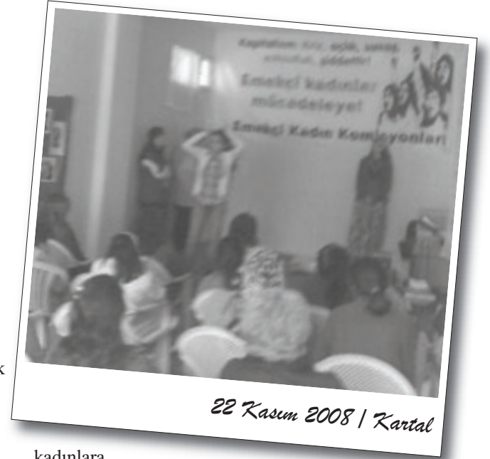
22 Kasım 2008 / Kartal

Son olarak, emekçi kadınların kapitalist cendereden nasıl çıkması gerektiği ve hangi araçlarla emekçi