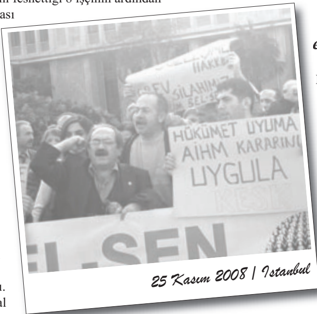
25 Kasım 2008 / İstanbul